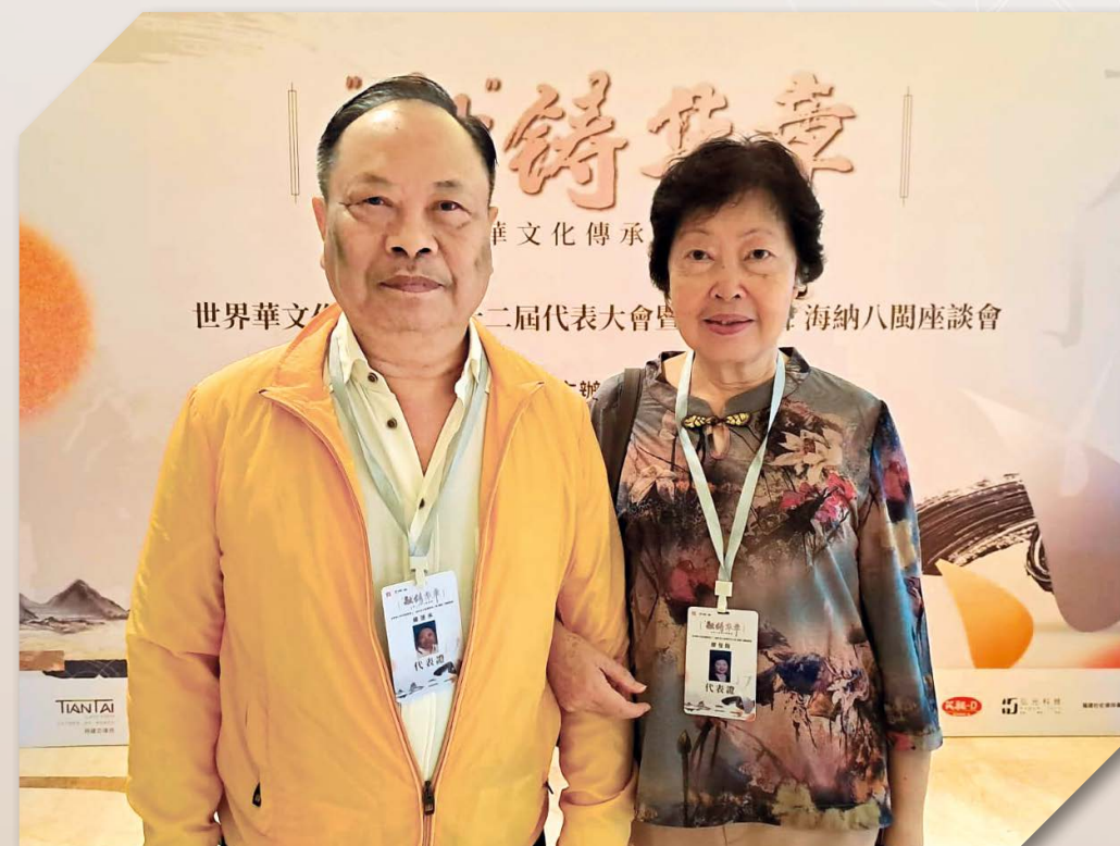
作者與太太繆曼斯合照

入冬季後，北極國芬蘭，漫玲瓏景。 千湖夜永，幻照北極光影。 伊嶺天廛躑躅，掛金輓，銀車翠綆， 貽珍歲歲飛馳，舊諾年年新證。