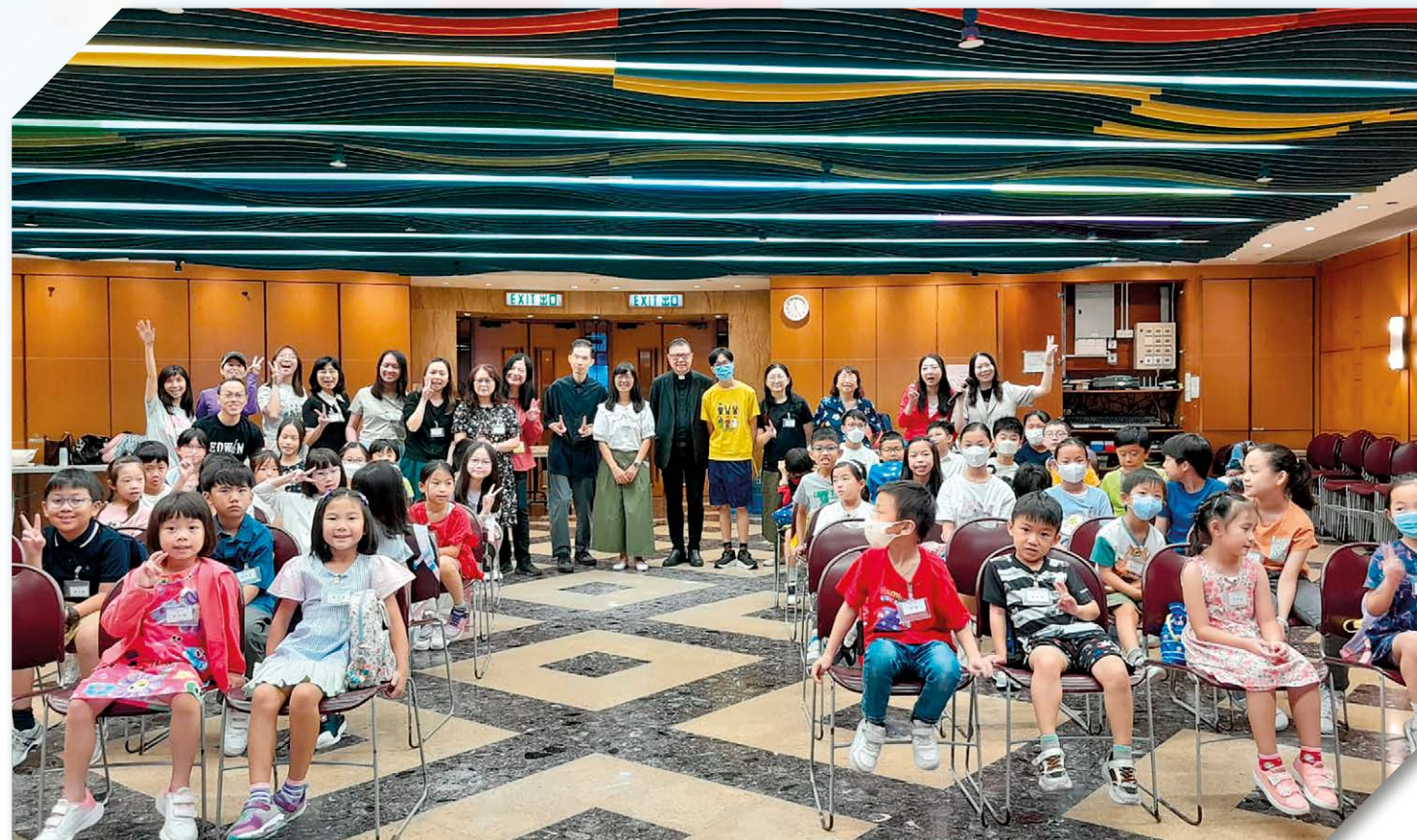
活動後，老師學生全體大合照